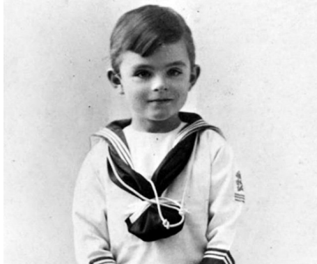
Alan Turing (5 Jahre alt)