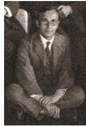
Tibor Radó, BB-Erfinder

Eine leichte Abwandlung des Schrittzählers ist das Busy-Beaver-Problem: